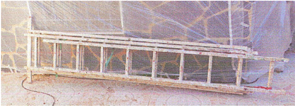
Imagen 2. Escalera manual extensible de tres tramos