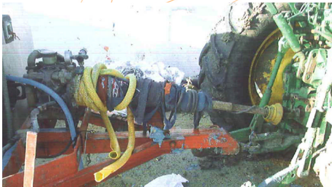
Foto 2. Ropa y otros elementos enganchados al árbol de transmisión de fuerza.