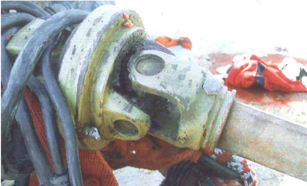
Foto 3. Detalle del mecanismo cardán sin resguardo.