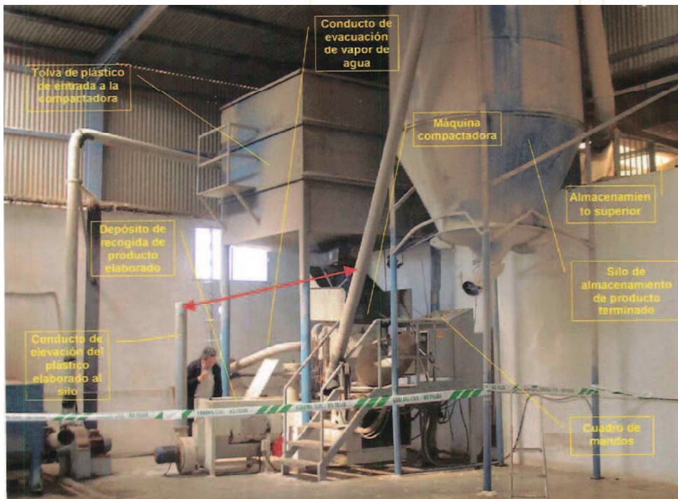
Imagen 1. Detalle de la zona de la máquina compactadora

En un lateral del cilindro, existe una compuerta de descarga por donde se evacua el producto ya terminado que pasa a través de un tornillo sinfin al silo de almacenamiento. La máquina se dispone un sistema de extracción de los vapores de agua generados en el proceso. El manejo de la máquina se realiza por medio de un cuadro de mandos